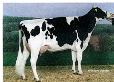
Un hijo en la IA es suficiente para erigir un monumento en su honor. La madre de Maserati, Conchita EX-90, es una Pronto de 4o parto que promedia 13,042 kg 3.66% 3.25%.

FORTALEZAS: patas & pezuñas/proteína/rasgos de salud